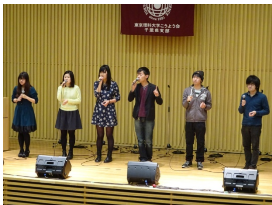
ボイストレーニング部

今後も、千葉県支部では、支部会員の皆さまの興味ある行事を開催してまいりますので、積極的にご参加いただければ幸いです。