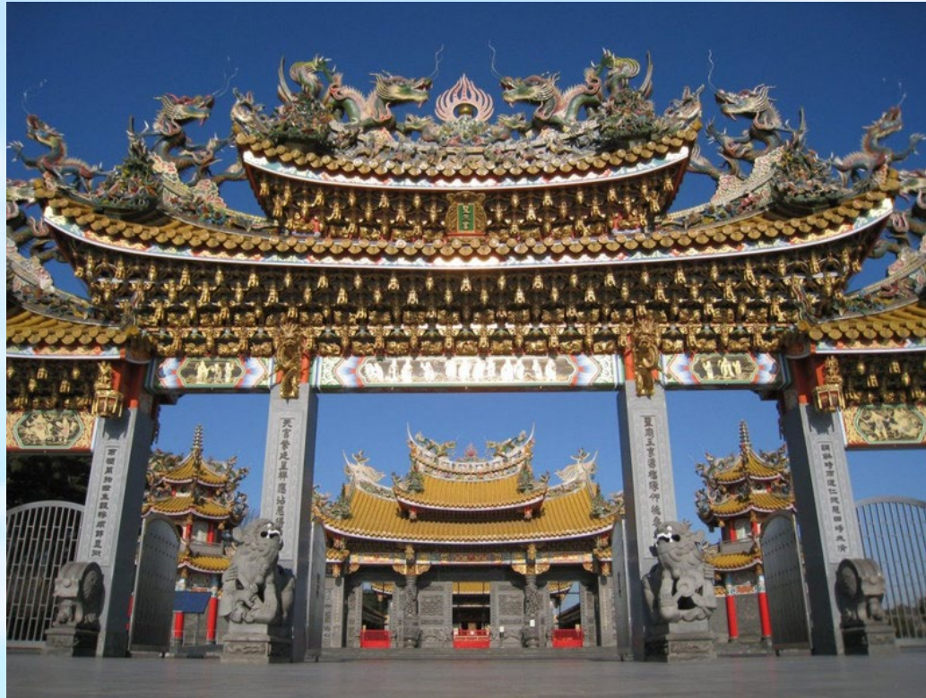
五千頭の龍が昇る聖天宮