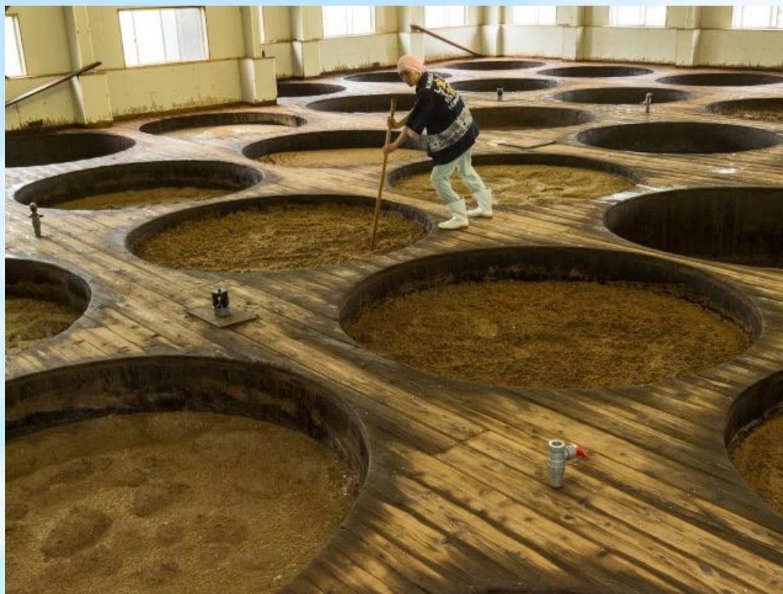
金箔しょうゆパーク