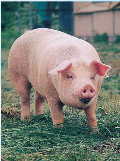
ゴールデンポークちゃん