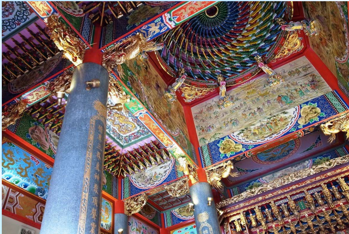
五千頭の龍が昇る聖天宮