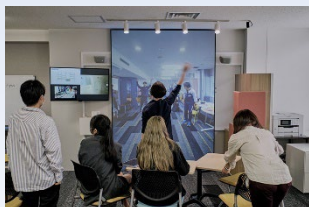
神楽坂キャンパス・富士見校舎